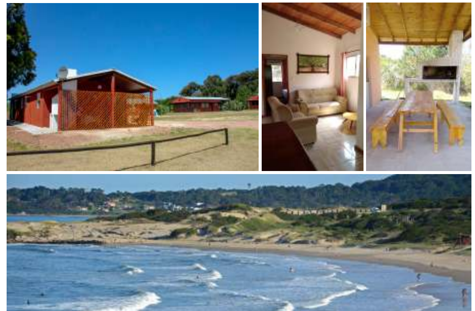
Playas en el Parque Nacional Santa Teresa

Se dispone de 6 cabañas; 4 unidades para 4 personas y 2 con capacidad hasta 6 personas, equipadas con todo el confort (ropa de cama, hogar a leña, aire acondicionado, TV cable, parrillero y estacionamiento techado individual).