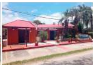
“Palmeras de Merín”